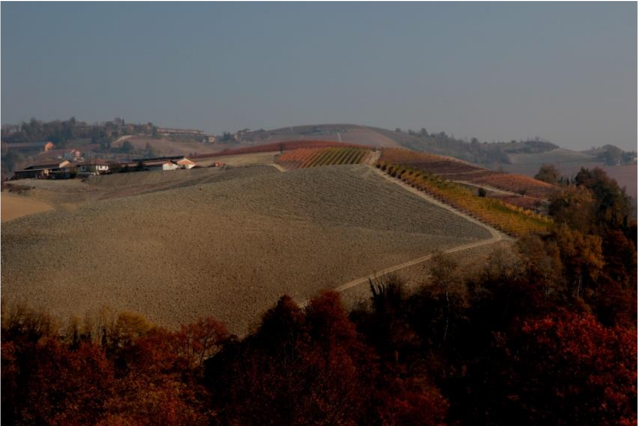
Nei dintorni di Monforte

Oltre al NEBBIOLO, i vitigni principali del Piemonte sono quasi tutti a bacca rossa: BARBERA, DOLCETTO, GRIGNOLINO, FREISA. Per i bianchi segnaliamo ARNEIS, CORTESE, ERBALUCE e FAVORITA. Non mancano i vitigni internazionali come lo CHARDONNAY, coltivato in Langa e Monferrato da oltre due secoli.