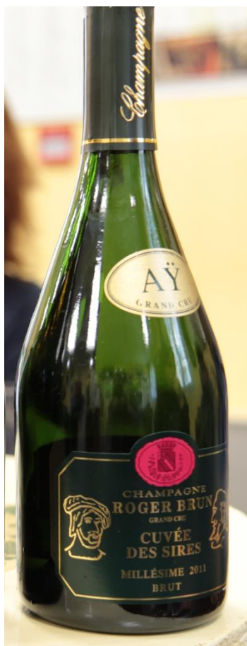
N. articolo: RB-B005 bottiglia 0,75l

100% Grand Cru 85% PN 15% CH Dosaggio: 8 gr/l Maturazione: 84 mesi