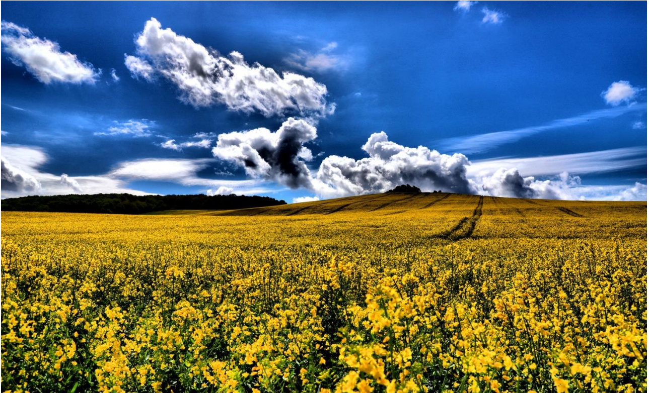
La Valle della Marna in primavera

Questo know-how è stato tramandato di generazione in generazione affinché questa esperienza insostituibile, associata alla cura costante nello sviluppo delle annate e ad una passione costante, contribuisca pienamente all'eccellenza degli Champagne prodotti dalla nostra casa.