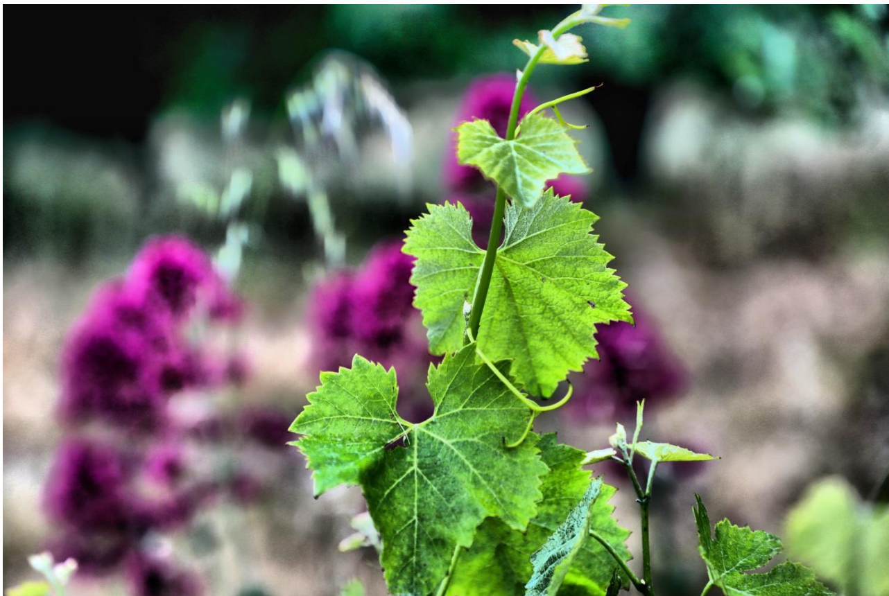
Giovani vigneti nelle tenute Scilio

Per la nostra famiglia, fare vino significa soprattutto coltivare il vigneto, curarlo affinché possa dare i migliori frutti da trasformare in un vino che deve conservare i caratteri della terra da cui proviene.