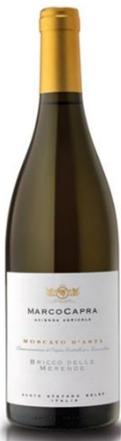
N. articolo: MC-B007 bottiglia 0,75l