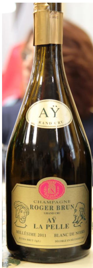
N. articolo: RB-B006 bottiglia 0,75l

100% Grand Cru 100% PN Dosaggio: 3 gr/l Maturazione: 84 mesi