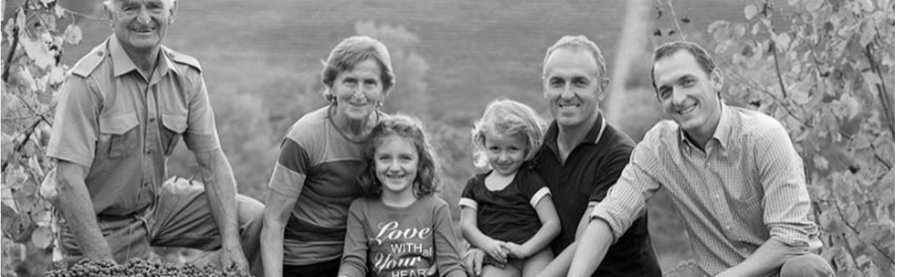
La Famiglia Pelassa

Situata a Montà d'Alba l'azienda Agricola Pelassa conduce vigneti nel Roero e a Verduno – per la produzione del Barolo-. Grazie alla coerenza nelle scelte unite alla dedizione al lavoro e all'amore nella cura dei particolari, l'azienda Pelassa ha saputo negli ultimi anni affacciarsi su mercati non solo nazionali ma anche esteri, inserendosi in poco tempo sulle carte vini dei migliori ristoranti in Europa, America e Asia.