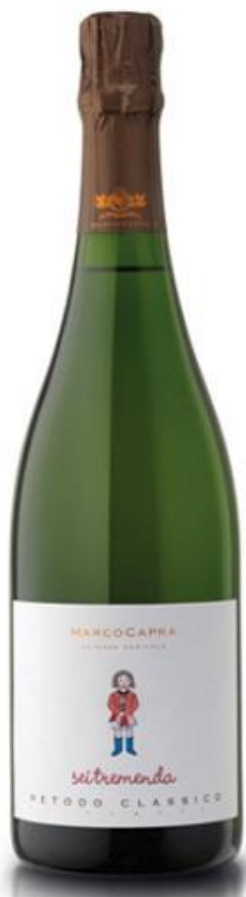
N. articolo: MC-B006 bottiglia 0,75l